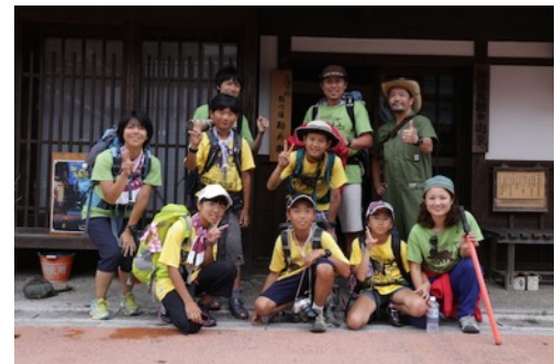
最後には、子供も大人スタッフもみんな家族のよう