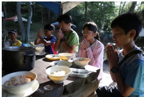
みんなでご飯を作ってくださいます！