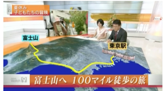
2013年8月14日 NHKニュースウォッチ9 100milesAdventure 東京駅～富士山頂 特集