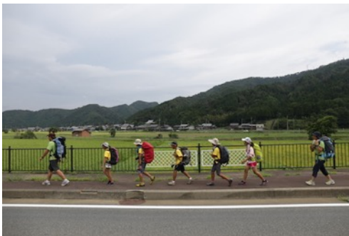
毎日20km前後を歩く。160km10日間の歩き旅

「歩く」「生活する」「進む」という普遍的な行為こそがアクティビティとなるように、旅の間には予定調和的な体験プログラムは極力排除し、それぞれの子供たちに合った成功体験を得て、再び自分の生きる世界に帰ってってもらいたいと考えています。