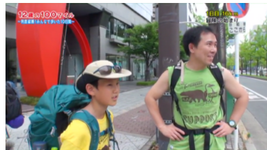
2014年9月23日 BS朝日 「ひと夏の冒険・12歳の100マイル」60分